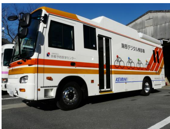
胸部X線デジタル検診車外観