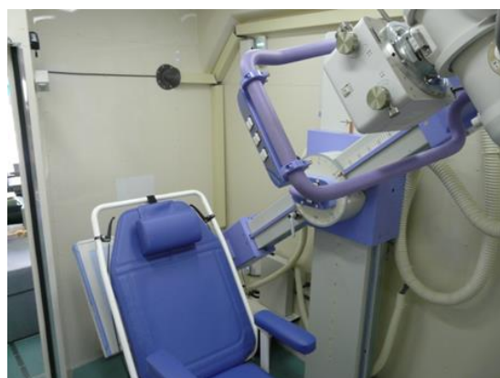
旋回アームおよび車イス

今回の検診車（写真左）の製作にあたってのポイントは車イスやストレッチャーを利用したまま受診できる環境を整備したことです。